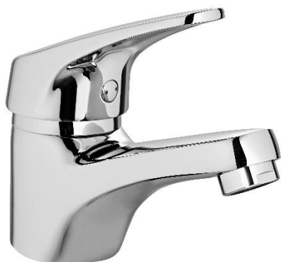
IMAGEM* | IMAGE*