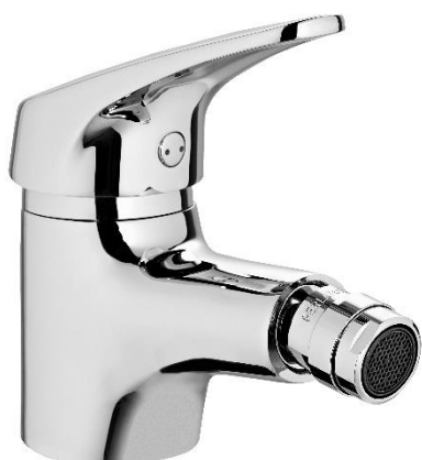
IMAGEM* | IMAGE*