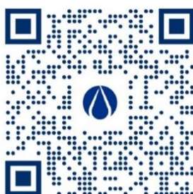
INSTRUÇÕES DE MANUTENÇÃO | MAINTENANCE INSTRUCTIONS

* Imagem não contratual | *Non-contractual image